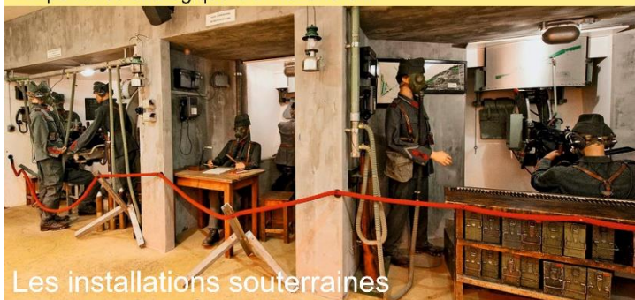
Les installations souterraines

Depuis l'esplanade du fort, sur les hauts de Vallorbe, la vue sur le col de Jougne est imprenable et magnifique. Il est facile d'évaluer l'importance stratégique d'un tel endroit.