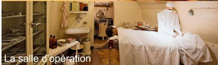
La salle d'opération