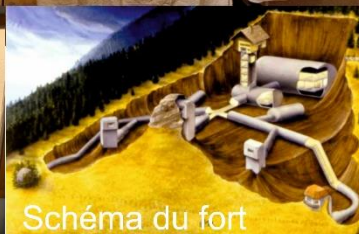
Schéma du fort